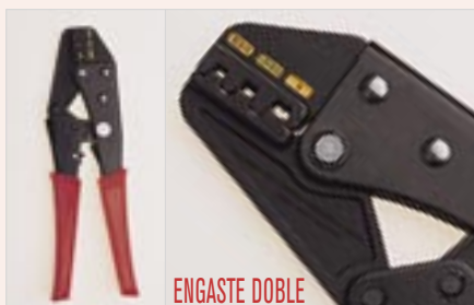
MH-3-F 415 gr 1

Engaste de terminales con garras, de secciones: mm 2 .-DIN 0,5-1,0 1,5-2,5 4,0-6,0