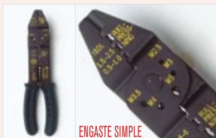
XB-052 200 gr 1

Engaste de terminales con garras, de secciones: de 0,5 a 6,0 mm 2 . Corta y pela cables de 0,75 a 6,0 mm 2 . Cortar tornillos hasta M-5