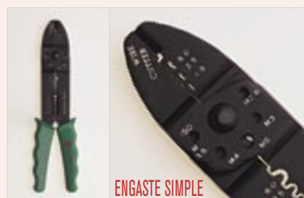
MEB-600 275 gr 1

Engaste de terminales con garras, de presión, DIN y UL. Secciones: de 1,5, 2,5 y 6,0 mm 2 . Corta y pela cables de 0,75 a 6,0 mm 2 . Corta tornillos hasta M-5.