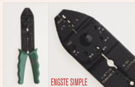
MEB-300 220 gr 1

Engaste de terminales con garras, de secciones: 1,5, 2,5 y 6,0 mm 2 ., delco y bujía. Corta y pela cables de 0,75 a 6,0 mm 2 . Corta tornillos hasta M-5.